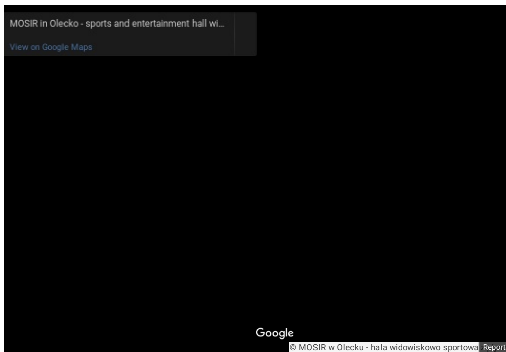
08 Pływalnie - widok z trybun