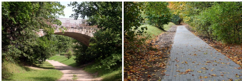
Budowa Wiewiórczej Ścieżki