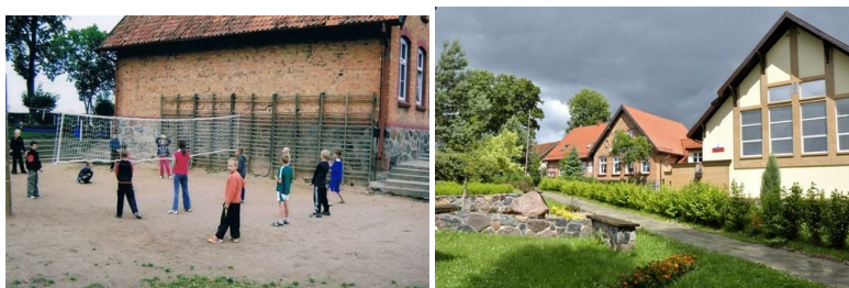
Gimnazjum nr 2 w Olecku przed i po modernizacji