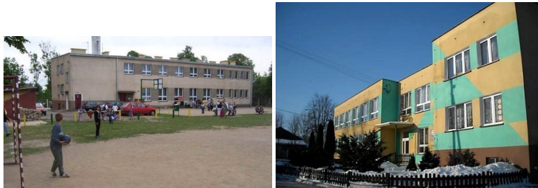
Szkoła w Gąskach przed i po modernizacji