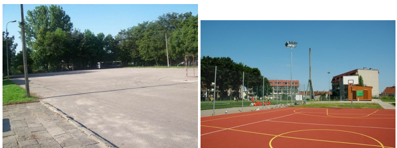
Szkoła Podstawowa nr 3 przed i po modernizacji