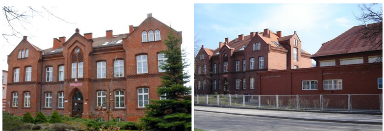
Obiekty sportowe przy Szkole Podstawowej nr 3 przed i po modernizacji