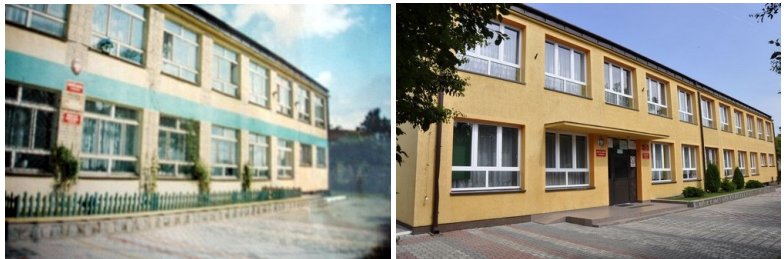
Szkoła w Kijewie przed i po modernizacji