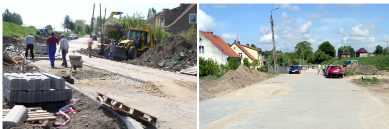
Budowa dojazdu do sklepów i stacji benzynowej przy Alejach Lipowych