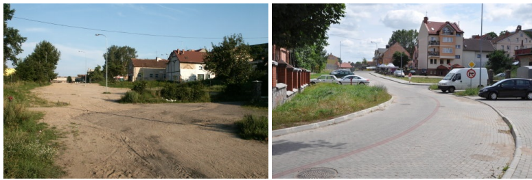
Przebudowa ulicy na Osiedlu Siejnik i tzw. "Podkowy"