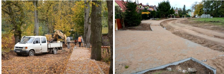
Przebudowa ulicy Słowiańskiej