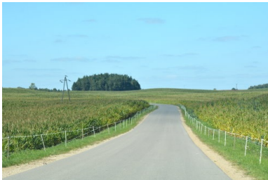
Inwestycje w gospodarkę komunalną ➡