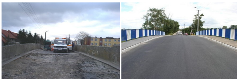
Przebudowa ulicy Leśnej