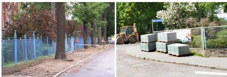
Przebudowa ulicy Spacerowej