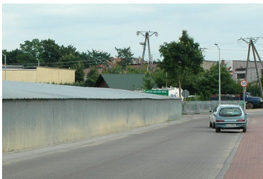
Droga Ślepie - Zajdy po modernizacji