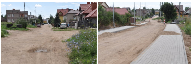
Przebudowa ulicy Pawłowskiego