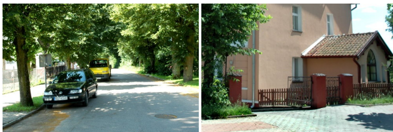
Przebudowa ulicy Zamostowej