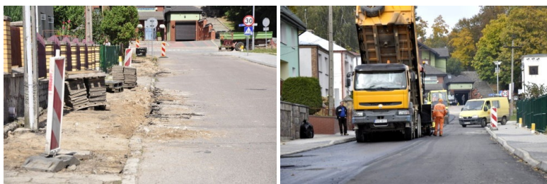
Przebudowa ulicy Dąbrowskiej