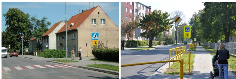
Przebudowa ulicy Przytorowej