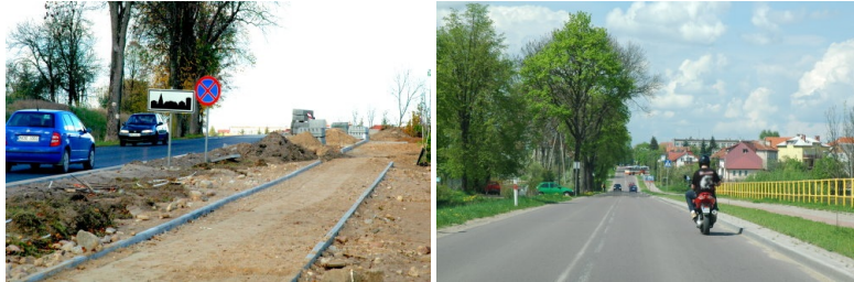
Przebudowa ulicy Kamiennej