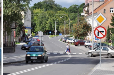
Przebudowa Alei Lipowych