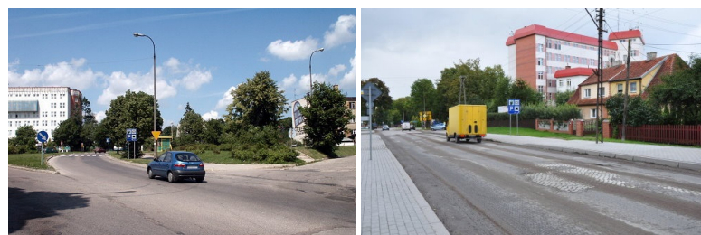
Budowa przejścia dla pieszych przy wiadukcie w kierunku Osiedla Siejnik