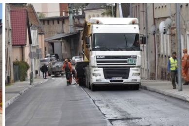
Remont ulicy Nocznickiego