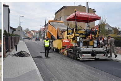
Remont ulicy Młynowej