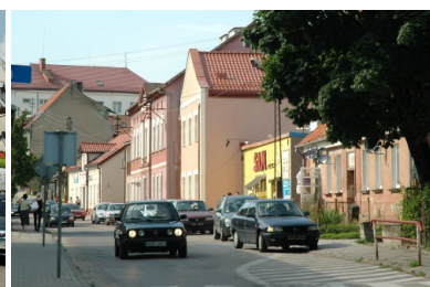
Przebudowa ulicy Targowej