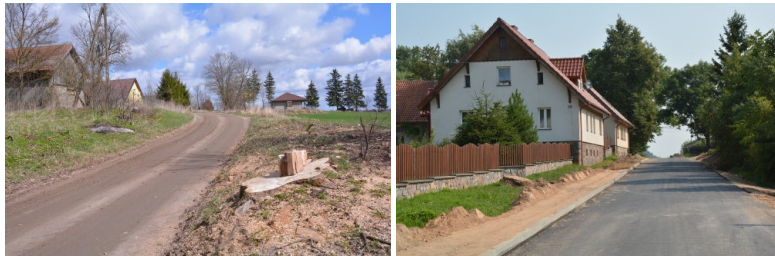
Budowa chodnika w Lenartach