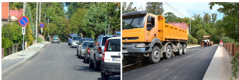
Przebudowa ulicy Kościuszki