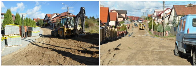
Budowa chodnika na ulicy Kościuszki