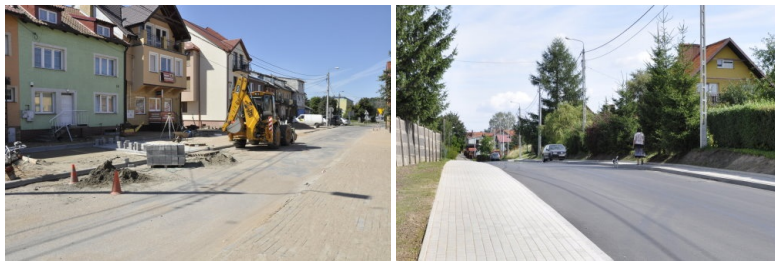
Przebudowa ulicy Wodnej