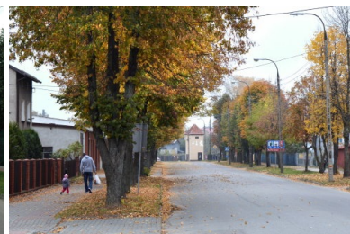
Remont ulicy Mazurskiej