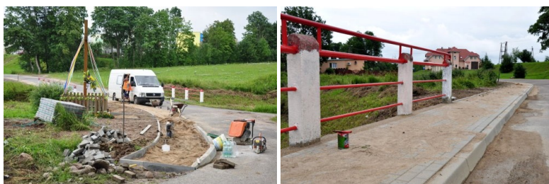
Inwestycje na wsiach "➡"