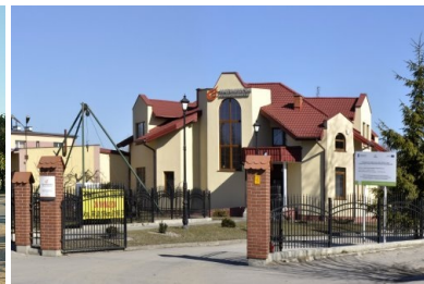
Przebudowa ulicy Grunwaldzkiej