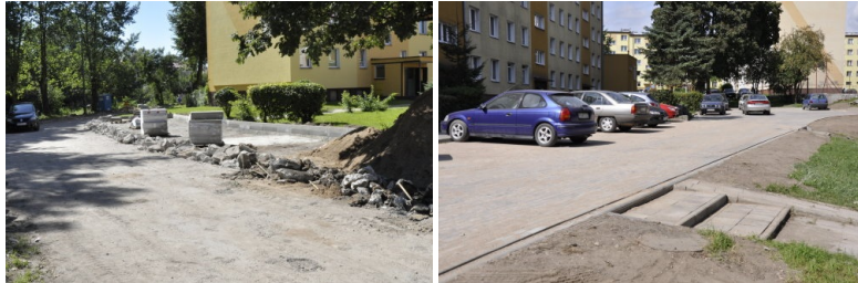
Modernizacja ulicy Gołdapskiej