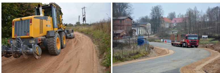
Remont drogi Zajdy - Dudki