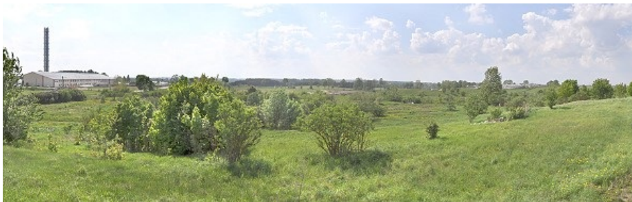
Tereny Aktywności Gospodarczej

Pomioty gospodarcze inwestujące i prowadzące działalność gospodarczą na Terenach Aktywności Gospodarczej zwolnione są z podatku od nieruchomości w okresie pierwszych 10 lat prowadzenia działalności. Prawo do tego zwolnienia wygasa po upływie dwóch lat od nabycia gruntu jeżeli pomiot nie rozpocznie działalności produkcyjnej lub usługowej.